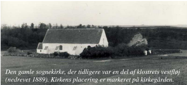
Den gamle sognekirke, der tidligere var en del af klosterets vestfløj (nedrevet 1889). Kirkens placering er markeret på kirkegården.