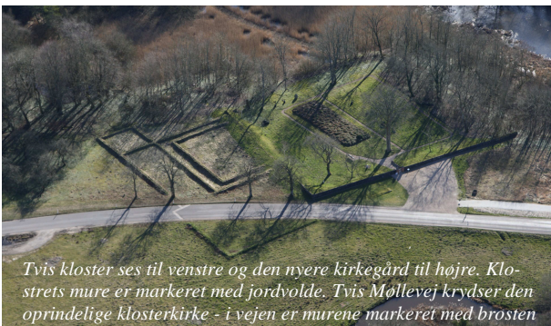
Tvis kloster ses til venstre og den nyere kirkegård til højre. Klosters mure er markeret med jordvolde. Tvis Møllevej krydser den oprindelige klosterkirke - i vejen er murene markeret med brosten

Mens det lukkede klosterområde var rammen om munkenes åndelige liv, var jordegodset det økonomiske grundlag, klosteret var baseret på. Tvis kloster må betegnes som et mellemstort kloster. I Møllebygningen finder du en større udstilling om klosteret.