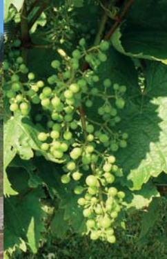
De ædle druer