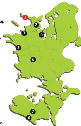
Layout: BI | Idebeklatne - Foto: Lønnebjerg, GEON, BI | Idebeklatne, VisitOdsherred