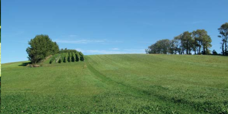
Bakket landskab omkring Lønnebjerg