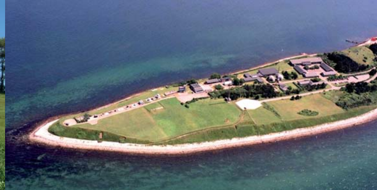
Gniben – Sjællands Odde's yderste spids