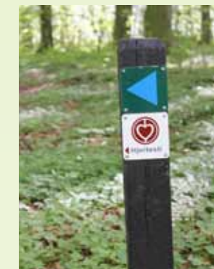
Begge ruter er tydeligt skiltede med sorte pæle og symboler.

Undersøgelser har vist, at 15 minutters hård træning om ugen forbedrer konditionen lige så meget som 10 timers (!) ugentlig træning ved lav intensitet. Få dig evt. en træningsmakker, så er der større chance for at holde motivationen oppe undervejs.