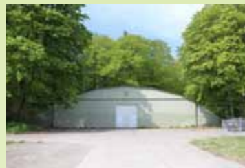
I skovens østlige side ligger en af de gamle hangarer, som blev bygget af tyskerne. Den bruges stadig til forskellige formål.

I direkte forbindelse med Knivholt Skov blev der i 1989 etableret en øst-vestgående vildtkorridor ud mod Bækmojenvej for at hjælpe dyrelivet i området. Længst mod vest findes Teglværks-skoven, der er en gammel græsningsskov. Hele området, inklusiv marker og huse er på 150 hektar. Heraf er ca. 60 hektar skovbevokset.