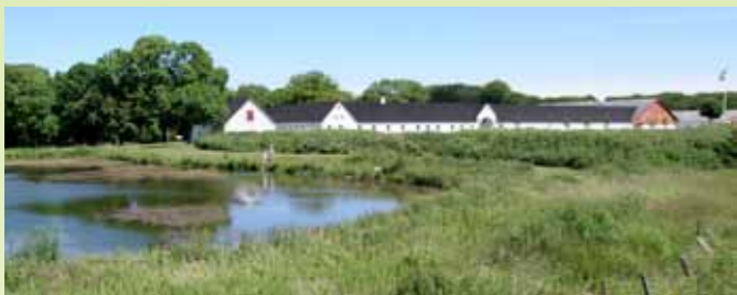
Den hvidkalkede hovedgård omringes af mange smukke søer.

Knivholt er desuden hjemsted for en lang række foreninger, en børnehave og Naturcenter Knivholt. Besøg også www.knivholt.dk – og læs hele historien om stedet og de mange muligheder.