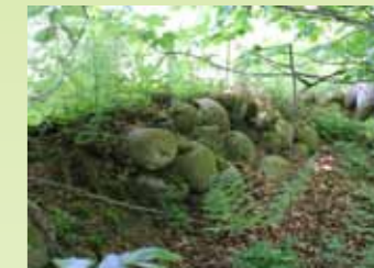
Gamle fredsskovsdiger kan stadig ses mange steder. Digerne blev opført for at beskytte de få resterende skovarealer i Danmark i starten af 1800-tallet.

Teglværksskoven har derimod i lange perioder ligget uberørt hen. Naturen er mere nærværende og kan tydeligt høres og fornemmes overalt. Denne del af stien er anlagt som natursti og kræver derfor egnet fodtøj. Der vil i perioder være vådt/blødt føre i området.