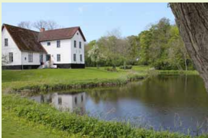
Hovedbygningen og én af de smukke søer, som oprindeligt var del af voldgraven.

Knivholt Skov er i dag rig på bl.a. stier og drives efter naturnære principper. Dvs. at der lægges vægt på brugen af danske træarter og udnyttelse af skovens egne processer til selvformering uden større fældninger. Det samme er gældende i Teglværks-skoven, der i ca. 20 år har været forskånet for større menneskelige indgreb. Området er naturskov, dvs. den er selvsået. Området præges af ellesumpe og eg, ask og bøg. Også engene indeholder mangeartede flora. Skoven afgræsses i dag, ligesom i tidligere tider, med kreaturer som en del af den løbende naturpleje.