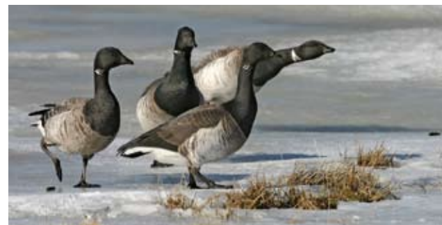
Her ses knortegæs fouragere.

Kyststrækningen ud for Mulbjergere er meget lavvandet, og nye, små sandøer opstår hvert år. Det lave vand er rigt på smådyr og ålegræs, som tiltrækker store fugleflokke. Havområdet besøges af fugle fra Nordeuropa og Sibirien og er derfor et vigtigt internationalt fuglebeskyttelsesområde.