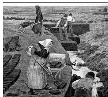
På tegningen ses tørveskær i 1884.