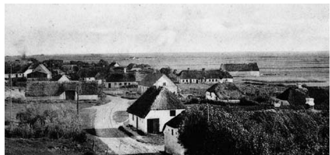
I ly af Mulbjergere udviklede Dokkedal sig gennem tiden til et fiskerleje med relativt små landejendomme og mange huse.

Takket være kartofflens stadig større udbredelse gav landbruget et voksende udbytte selv på de magreste jorder. Det betød nye muligheder for vækst på de sandede jorder, og fra 1787 og til 1845 steg husholdenes antal fra 19 til 48. Der var nu 16 større og mindre landbrugsejendomme og 28 huse i Dokkedal.