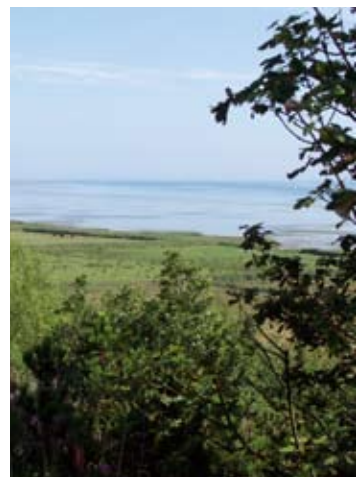
Udsigten fra P-pladsen nord for Stejlgabet.

Den sydlige del af Mulbjergere, med Gulhøj som højeste punkt ligger hen som overdrev og afgræsses af kreaturer. Du kan selv finde vej op over det smukke område. På toppen er der en fantastisk udsigt over Kattegat mod øst og Vildmosen mod vest. Området nord for Stejlgabet er det højeste. De anlagte stier snor sig mellem opdyrkede marker, overdrev og skovpartier. Flere steder fører stierne gennem indhegninger med får, heste eller kreaturer. Også her er der fantastiske udsigter. Det højeste punkt er 43 m o.h.