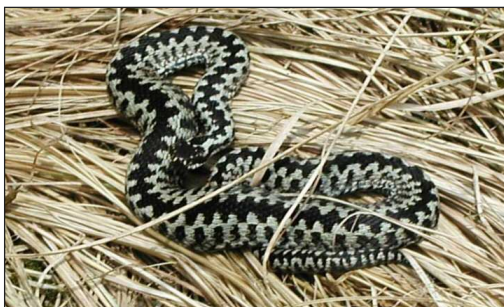
Hugormen er sky - bevæg dig stille, hvis du vil se den.

Der er et rigt fugle- og dyreliv omkring Stubbergård Sø. Er du heldig, kan du se fiskeørnen jage over søen, et firben, som soler sig eller de toppede lappedykkeres kurtiserende dans på vandet. Måske støder du også på spor efter oddere.