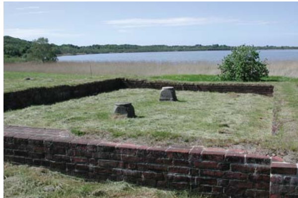
Dronningholm ligger med udsigt over Arresø.