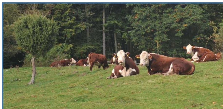
Foto: Naturplejerne tygger drøv på det lune overdrev. Tv. en opstammet ene.

Oplev spændende planter, insekter og svampe. Særligt de tørre overdrevspartier, som aldrig har været pløjet og opdyrket, er næringsfattige og