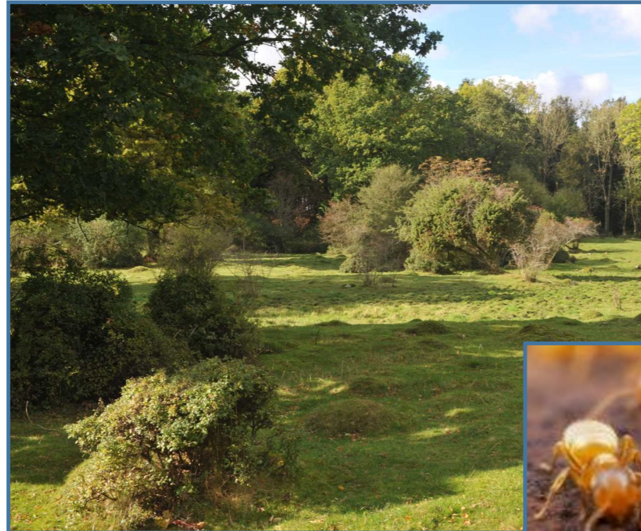
Foto: Overdrevsparti med de karakteristiske tuer af gul engmyre. I forgrunden et par nedbidte tjørn.

Allerede i 1925 blev et område på 2,2 ha fredet under navnet Kulebjerg, Ennishøj. Det sidste navn henryder til de enetræer, der vokser her, og som man ønskede at bevare. Fredningen omfatter gravhøjen på bakken.