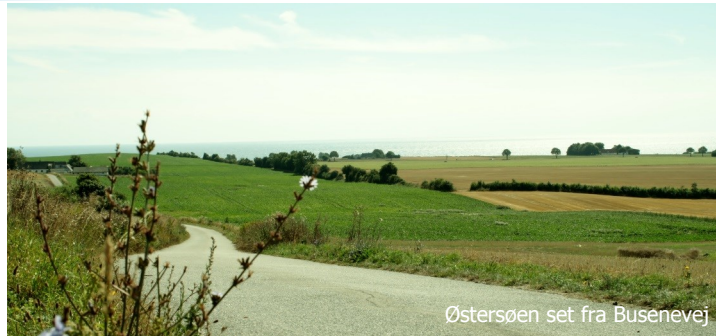
Østersøen set fra Busenevej

Møns Klint (13) er med de klippelignende kridtklinter, den stenede strand og det matgrønne hav en af Danmarks smukkeste kyststrækninger. Se Dronningestolen, det højeste punkt på Møns Klint med sine 128 m over havet. Ifølge sagnet sad Klintekongens dronning her og skuede ud over havet, mens Klintekongen var på togt. Bemærk bøgetræerne med de meget lysegrønne blade og krogede former, der skyldes den kalkrige jord. Med lyden af havet i ørerne og de smukke farveindtryk fra Møns Klint kører du gennem den grønne Klinteskov tilbage til Camping Møns Klint.