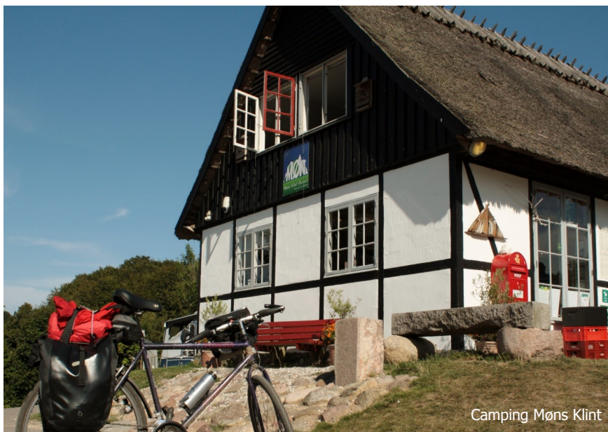
Camping Møns Klint

Trafik: Skovveje og asfalterede landeveje med beskeden trafik. Stærkt kuperet terræn. Ruten kan også anvendes som træningstur for "bjergryttere". Cykler med min. 5 gear anbefales. Uegnet for mindre børn.