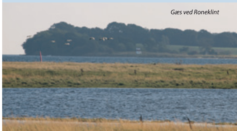
Gæs ved Roneklint

Når TUREn går tilbage mod Præstø, skal der af hensyn til fuglelivet ros/padles nord om øen Maderne . Turen ind mod Præstø er storslået, og du kan kun glædes over vildtreservatets mangfoldige fugleliv.