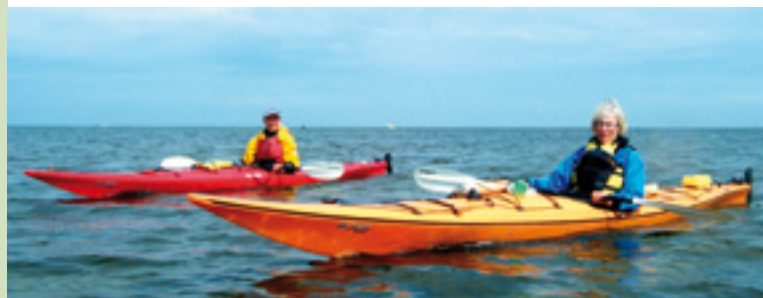
Shelter ved Fed Havn

Trækker en TUR på Præstø Fjord i dig, er du godt på vej med nærværende folder Præstø Fjord – fra søsiden i hånden.