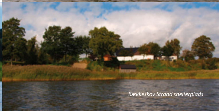
Bækkeskov Strand shelterplads