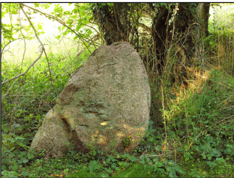
6: Bautasten langs stien lige øst for skansen.