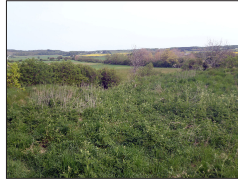
4: Udsigt fra skansen mod nord og "Høje Møn"