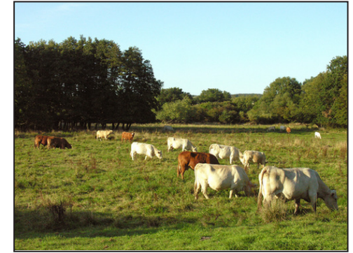
5: Kreaturer afgræser den smukke strandeng mellem Busene Have og skansen.