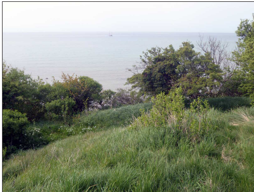
Udsigten fra Brøndehøje Skanse over Østersøen. Fra skansen kunne man let overskue havet.

Svenskekrigens skanse menes at være anlagt ovenpå et cirkulært voldsted, hvor der i middelalderen stod et tårn. men det er de store volde fra 1600-tallets skanse man i dag ser på stedet. Yderligere blev skansen også genbrugt og sikkert også ombygget under Englandskrigene 1801-14 ( se f.eks. Ulvshale skanse). Når du i dag besøger stedet ses en dyb tør voldgrav som omgiver en femkantede skansevold med en nordvendt adgangsåbning. Mod havet giver den stejle kystskrænt mod syd et naturligt forsvar for skansen.