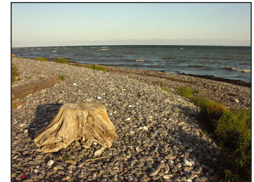
9: Fra kysten lige nedenfor skansen hvor Brøndehøje fiskerleje tidligere lå indtil stormfloden i 1625.