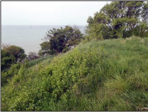
2: Skansen ligger på toppen af kystskrænten kort vest for parkeringspladsen.