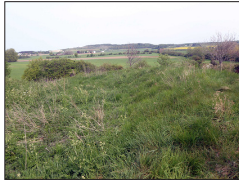
3: Top af skansebanken set fra syd