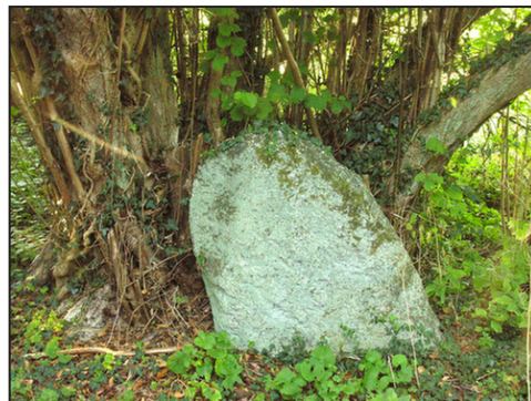
7: Bautasten langs stien lige øst for skansen.