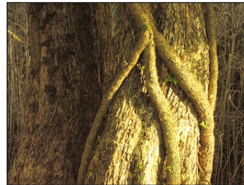
8: Krattet omkring skansen er eventyrligt. Vedbend snor sig omkring træstammerne og giver en helt speciel stemning.