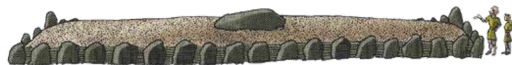
Bondestenalder ca. 3.600 f. Kr.