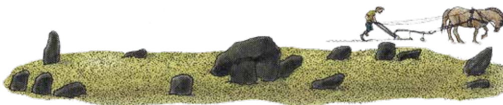
Nyere tid ca. år 1900