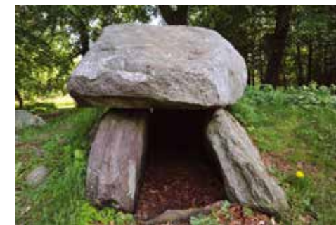
Det nordre gravkammer med tærskelsten ved den oprindelige gangåbning ind til kammeret.

På toppen af randstenene ved gangåbningerne blev mad- og drikofre til de afdøde hensat i ornamenterede lerkar. Lerkarrene