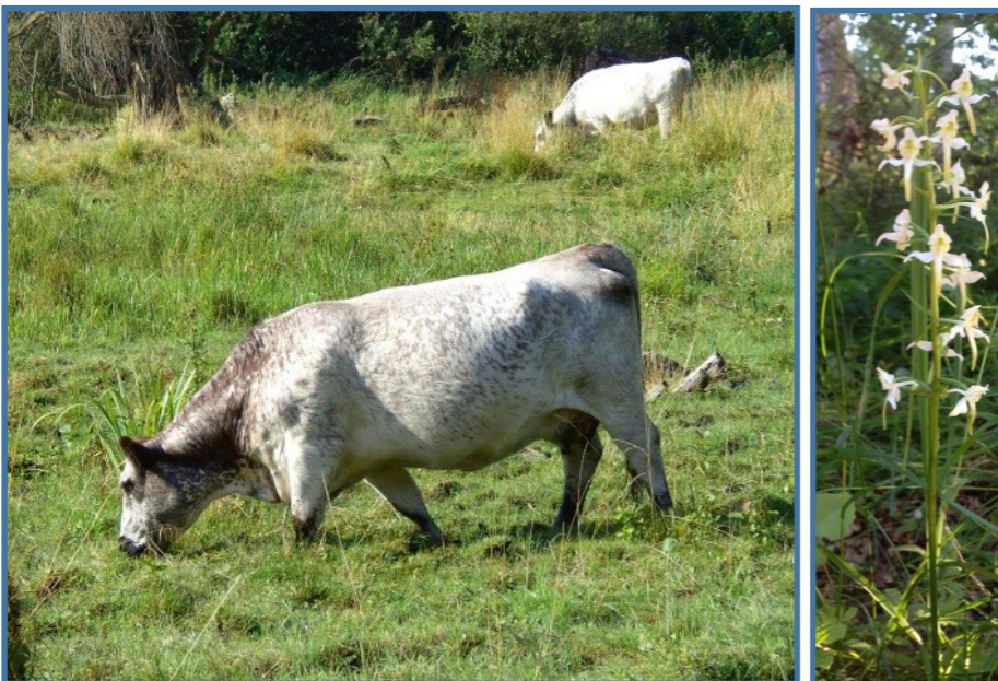
Foto: tv. et par lys-brogede Galloway og th. orkidéen Tyndakset gøgeurt.

Læs mere om Sorø Kodriverlaug på www.kodriverlaug.dk