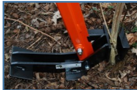
Foto: Rodoptrækker til mindre træer.

maskiner om nødvendigt. For at undgå sammentrykning af jorden bør kørsel med maskiner så vidt muligt undgås, og kodriverlaugets medlemmer udfører derfor rydninger af ung træopvækst med håndredskaber.