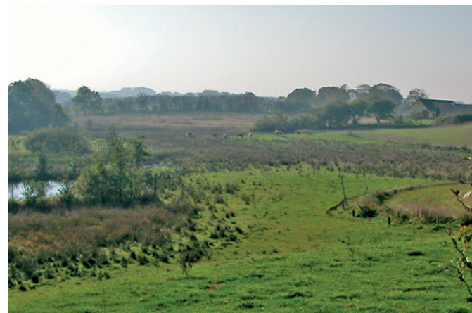
Selv om engarealerne har langt mindre udbredelse end tidligere, ses flere steder på ruten stadig græssende kreaturer, der ved deres tilstedeværelse bidrager til bevarelse af engene.

I det flade landskab mellem Tårs og Hjørring er de fleste arealer opdyrket. Selv langs Uggerby Å er det muligt at dyrke jorden, efter arealerne er blevet afvandet.