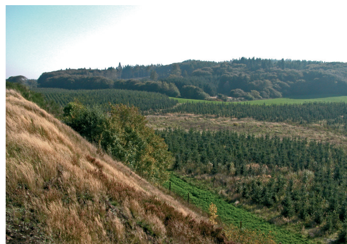
Nåletræsbeplantning mellem Kirkholt og Tårs

Flede steder langs ruten ses tilplantninger med juletræer, der er blevet meget populært de senere år. Træerne bliver ofte plantet, netop på disse tørre og sandede jorder, der ikke rationelt kan drives på anden vis.