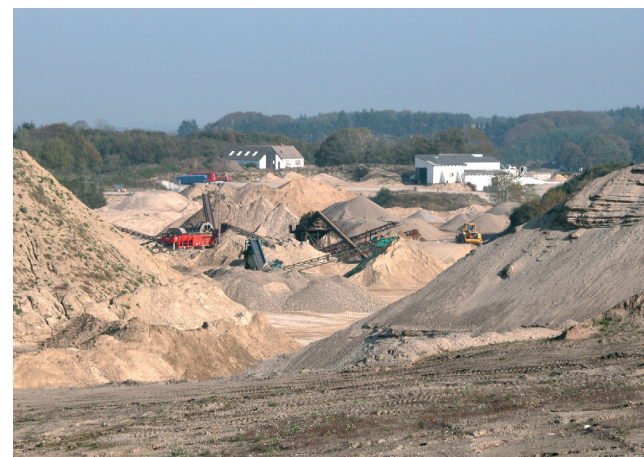
Stadig aktiv grusgrav ved Kirkholt

Millioner af kubikmeter sand og grus, som smeltevandet fra isen har aflejret i området øst for Kirkholt, er blevet gravet op og anvendt til anlæg og byggeri. De fleste af disse grave er nu lukket og efterbehandlet og anvendes til land- og skovbrugsformål.