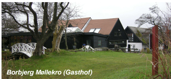
Borbjerg Møllekro (Gasthof)

Die Borbjerg Mühle wurde im Jahr 1408 erbaut. Die Mühle war im Laufe der Zeit Eigentum verschiedener Gutshöfe, bis diese im Jahr 1803 freigekauft wurde. 1931 richtete Johannes Kobborg hier eine kleine Gaststätte ein. Heute ist die Borbjerg Mühle ein Hotel / Gasthof / Restaurant mit dazugehörigen Kursus-räumen und -aktivitäten. Der Mühlensee ist in Besitz des Gasthofes, und hier kann man Boote mieten und einen Angelschein erwerben.