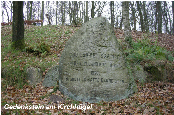
Gedenkstein am Kirchhügel

Auf dem See schwimmen Schwäne und nicht selten können Sie Fischreiher im flachen Wasser auf der Suche nach Fischen sehen.