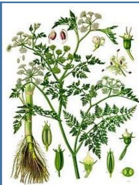
Foto af "Oenanthe" søen opkaldt efter det latinske navn for sumplante Billebo-klaseskærm, der ses ovenfor.

Ser du tegn på syge køer eller andet, så kontakt dyreholder.