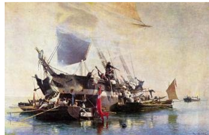
En engelsk Brig erobres af danske Kanonbaade (1887) Maleri af Chr. Mølsted.

An English gunboat captured by Danish gunboats