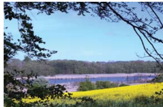
Udsigt over Even Sø fra Faksinge Skovs nordlige skovbryn.

Du må kun færdes på vej og sti og kun fra kl. 6.00 til solnedgang, og der er ikke den samme mulighed for overnatning, arrangementer og aktiviteter som i offentlige skove.