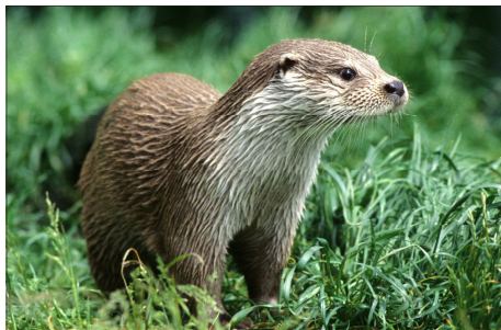
Der Otter ist ein nachtaktives Tier, hinterlässt doch Spuren an der Wasserkante.

Im Gebiet am Flyndersø gibt es ein reiches Vogel- und Tierleben. Wenn Sie Glück haben, können Sie einen Fischadler über dem See jagen sehen; Salamander, die sich von der Sonne wärmen lassen oder Rotwild auf der Suche nach Fressen. Vielleicht sehen Sie auch Spuren von Ottern.