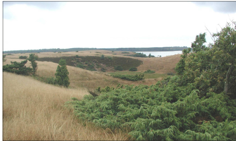
Toteis-Löcher bei der Brejnskov-Brücke

Der Bachtal-pfad am Flyndersø windet sich ca. 3,5 km entlang den Hängen des Stubber Baches. Die Wanderung führt durch Moore und Dorfgemarkungen, entlang Heidegebieten und uraltm Eichendickicht mit verwachsenen Eichen. Von verschiedenen Aussichtspunkten ist der Flyndersø zu sehen, der sich über 8 km nach Norden erstreckt, bevor dieser in den Karup-Fluss mündet