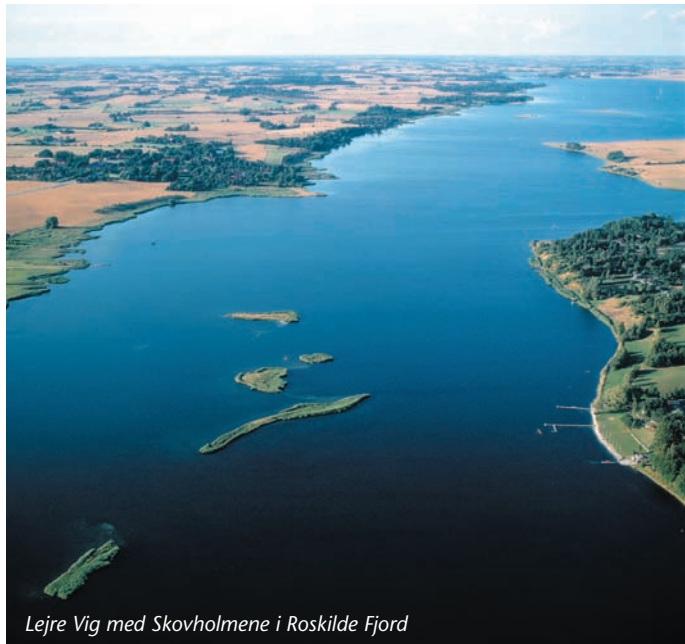
Lejre Vig med Skovholmene i Roskilde Fjord