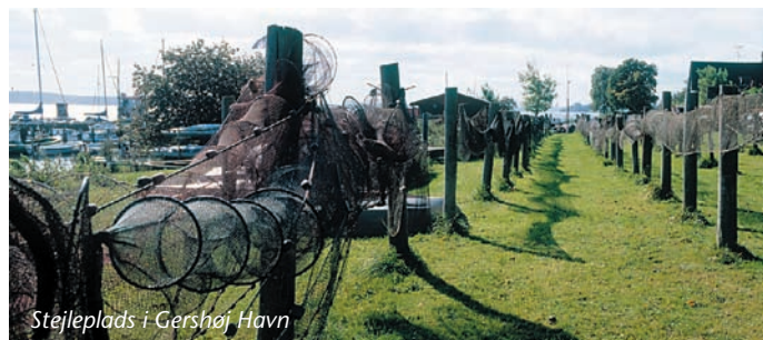
Stejleplads i Gershøj Havn

Roskilde Fjord er et af Danmarks vigtigste områder for vandfugle. Det lavvandede område med krebsdyr og muslinger samt de mange øer og holme gør fjorden attraktiv som yngle- og rastelokalitet. På de ca. 30 øer og holme yngler hvert år 20.000 par fugle, fortrinsvis måger, svaner, terner, klyder, strandskader, viber og i mindre omfang edderfugle, skalleslugere, skeænder, grågæs og rødben. Uden for yngletiden fungerer fjorden som raste- og fourageringsområde for godt 50.000 vandfugle. Øerne er fredede, og færdsel er forbudt i yngletiden fra 1. april-15. juli på øer og holme samt i en 50 m zone rundt om disse. Roskilde Fjord og kystnære områder er udpeget som EF-fuglebeskyttelsesområde og EF-Habitatområde, hvilket forpligter Danmark til at beskytte fjordens fugle og øvrige dyre- og planteliv.