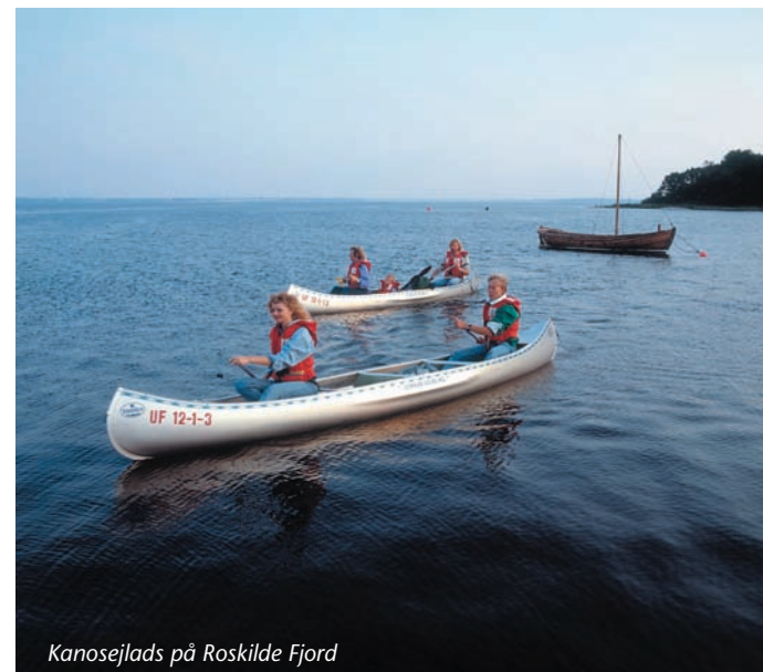
Kanosejlad på Roskilde Fjord

Borrevejle Center er et 24 tdl. stort rekreativt og naturskønt område lige ud til Roskilde Fjord med udsigt til Skovholmene. Herfra kan man bade og sejle i kano, campere og dyrke forskellige former for ude- og indendørs sport. En teltplads med vejrlig kan benyttes mod betaling 20 kr. pr. person. Følg afmærkning.