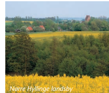
Nørre Hylinge landsby

I fjordens sydligste og mest brakke del ligger fem små rørbevoksede Skovholme. Skovholmene adskiller sig, både hvad plante- og fugleliv angår, fra fjordens øvrige holme. Bevoksningen med tagrør er den mest iøjnefaldende forskel, men der er også fundet visse ualmindelige arter, som ikke findes andre steder i fjorden, f.eks farvevaid, strandkvan og samel. Blandt ynglefuglene findes ferskvandsarter som toppet- og gråstrubet lappedykker, grågås, troldand og blichøne, men også fjord- og havterner samt måger yngler her. I de seneste år er sågar svartbagen, som tidligere kun fandtes i marine områder som Kattegat, begyndt at yngle i fjordens allermest ferske del.