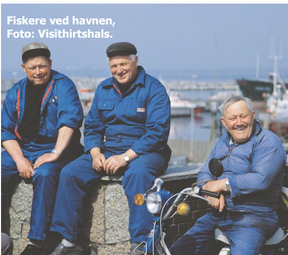
Fiskere ved havnen, Foto: Visithirtshals.