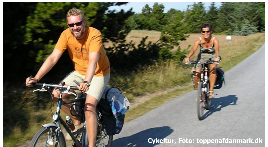
Cykelstur, Foto: toppenafdanmark.dk