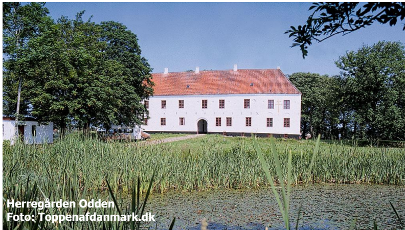
Herregården Odden