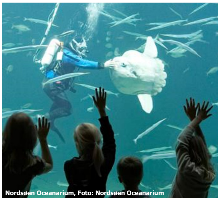
Nordsøen Oceanarium