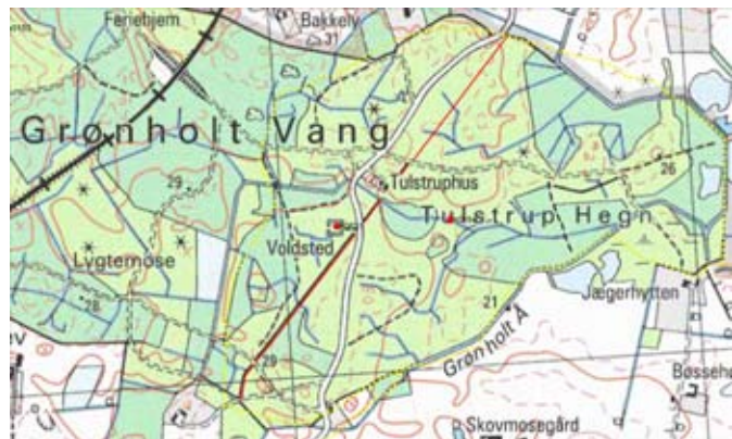
Fig. 4. Oplysninger fra 1776-kortet overført til 4cm kort. Tulstrups gamle afgrænsning er markeret med den gule punktlinie.

På to kort fra henholdsvis 1776 og 1784, hvor sidstnævnte baserer sig på opmålingerne fra 1776, findes dette dige imidlertid ikke. Derimod findes der et dige eller skel indtegnet noget længere mod vest (fig. 3). Ud for voldstedet løber diget 175 meter vest for dette. Det er dette dige, som var det gamle bebyggelsesskel mellem Tulstrup mod øst og Gamle Grønholt, som var en bebyggelse, som lå mod vest i vangen af samme navn.