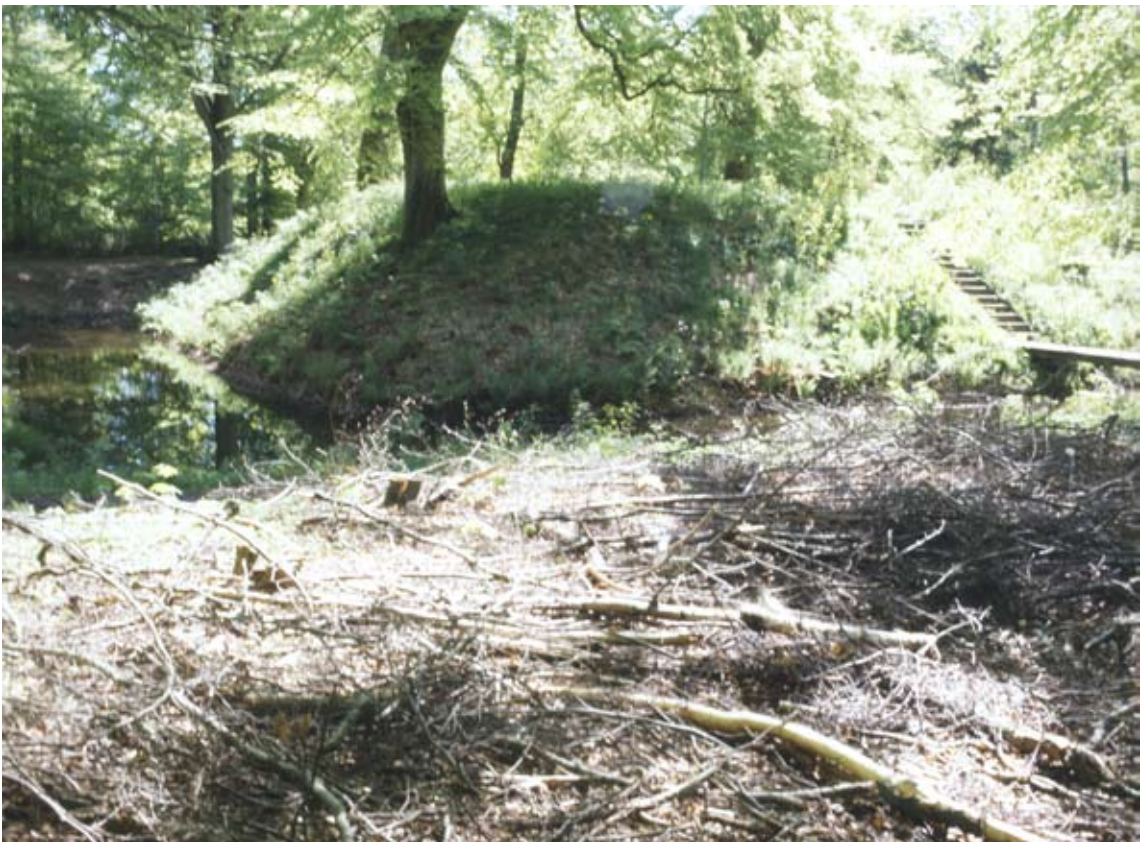
Fig. 6. Grønholt Voldsted, som det tager sig ud nu til dags. Endnu har det ikke afsløret alle sine hemmeligheder!

Kan der være en forbindelse mellem Roskildebispen