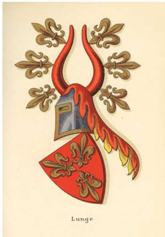
Fig. 5. Adelsslægten Lunges våben. Gengivet fra Danmarks Adels Aarbog 1902.

Selv om den første skriftlige kilde, som omtaler Tulstrup, først er fra 1387, og altså antageligt fra tiden efter, at voldstedet havde mistet sin forsvarsmæssige betydning, giver den os alligevel et spor til, hvem der kan have opført voldstedet. Tulstrup var nemlig på dette tidspunkt i adelsslægten Lunges besiddelse. Netop denne slægt havde i 1300-tallet sikret sig en betydelig magtbasis og stor rigdom. I Danmarks Adels Aarbog (1902) skrives således: Faa