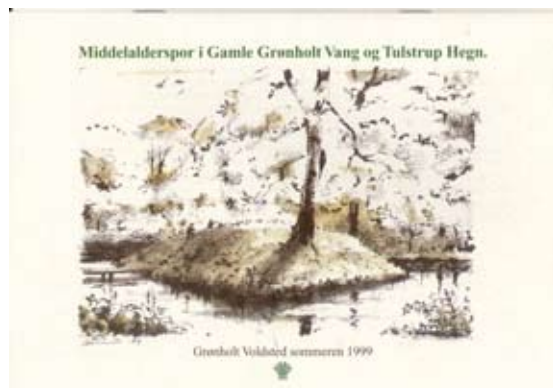
Fig. 2. I forbindelse med forskønnelsen af området ved voldstedet udgav Skov- og Naturstyrelsen i 1999 en lille turfolder med stemningsfyldte tegninger af Des Asmussen og tekst af forfatteren.

For få år siden gennemførte Kronborg Statskovdistrikt en forskønnelse af området, ligesom publikumsinformationen blev forbedret.