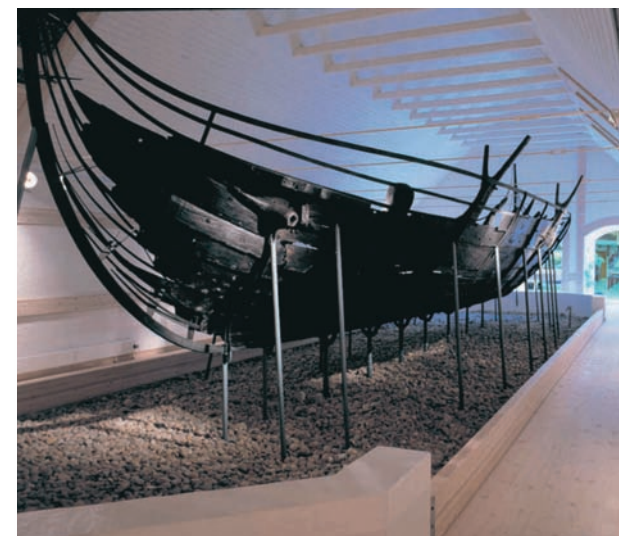
Ellingåskibet, der kan ses på Bangsbomuseet

Syd for Strandby er den gamle naturhavn omkring udmundingen af Elling Å. Her er der fundet et middelalderskib, som kan ses på Bangsbomuseet. Med naturhavnens tilsanding og landhævningen i Vendsyssel skabtes et område, der var perfekt til kreaturgræsning, som den bagvedliggende herregård Lerbæk specialiserede sig i. Området er i dag internationalt fuglebeskyttelsesområde.