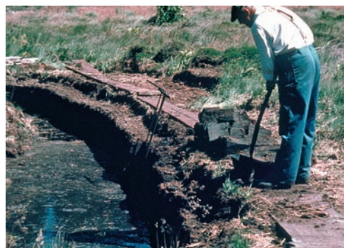
Tørvegravning på gammel-dags maner

Opindeligt blev overdrevsområderne inde i land afgræsset af får, heste og kvæg. Flere kilder taler om opdræt af krigsheste i området i 12-1300 årene. En anden udnyttelse var tørvegravning, og hedebønderne omkring udflytterbyen Jerup sendte tørv til opvarmning og madlavning over Fladstrand (Frederikshavn) til København.