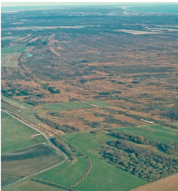
Rimme-doppelandskab ved Råbjerg Mose

I baglandet mellem Ålbæk og Strandby ligger store mose- og hedestrækninger, der er dannet efterhånden, som havet efter istiden har trukket sig tilbage foran den gamle kystskrænt, der går fra Frederikshavn til Hirtshals. Sandfygningen har forårsaget tilblivelsen af klitterne. De såkaldte rimmer (langsgående volde) i nord-sydgående retning er resultat af den fremherskende vestenvind. I læ af rimmerne er moserne, de såkaldte dopper, dannet som resultat af de dårlige afløbsforhold.