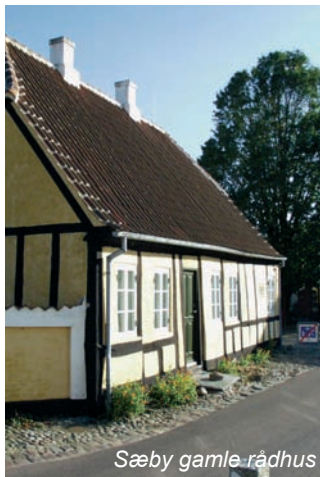
Sæby gamle rådhus

Sæby opstod ved kysten langs Sæby Å og har herved fået en oprindelig øst-vest orientering. Det tidligste Sæby er sandsynligvis vokset frem som et to-delt samfund, - et fiskerleje ved kysten og en landsby ved et vejkryds og broen over Sæby Å. Byens udstrækning begrænsede sig stort set til Algade, der snøede sig langs sydsiden af åen, fra kysten til Søndergade. I byen var der en udtalt kvartersdeling, hvor søens folk og fiskerne boede i den del af hovedstrøget, der lå øst for den gamle klosterkirke, det der i dag er Strandgade. Gaden mandede tidligere direkte ud i stranden. Husene i dette kvarter var væsentligt mindre end de større embedsmandsboliger og købmandsgårde, der lå i den vestre ende af hovedstrøget, det nuværende Algade.