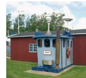
Havnemuseet har til huse i de gamle røde fiskerhuse på selve havnearealet.

Asaa Borgerforening, oprettet 1907, begyndte i 1927 at afholde hestevæddeløb. Det blev en stor succes og har været afholdt hvert år siden, kun afbrudt af besættelsen. I den lokale Turistinformation fra 1993 fortælles: "Ikke mange meter fra Asaa Camping ligger Asaa festplads, hvor der i mere end 50 år har været afholdt et årligt hestevæddeløb - en festdag, der år efter år trækker tusinder af mennesker til byen". I dag afholdes Asaa marked samtidig med væddeløbet. Banen er ejet af borgerforeningen, der lige har bygget nye faciliteter.