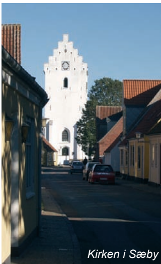
Kirken i Sæby

For enden af Algade, nord for åen, ligger Sæby Mølle. Anlæggelsesåret kendes ikke, men møllen eksisterede i hvert fald i 1640. Ved inddæmning er der skabt en møllelesø, hvor den stille å opstemmes ved stemmeværket, for at blive ført ind til to store møllehjul, underfaldshjul, der i 1926 blev erstattet af en turbine. Fra 1805 var møllen igennem flere år i slægten Aabels eje. I 1938 blev møllen nedlagt og omdannet til snedker- og karetmagerværksted. Møllen er omfattet af bevaringsplanen fra 1968 og er i dag fredet.