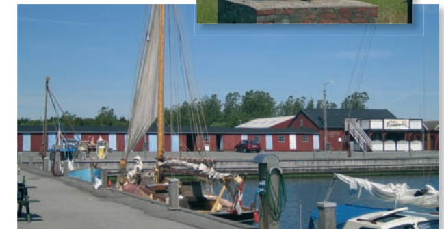
Asaa Havn med de gamle redskabshuse i baggrunden.