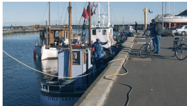
Aktivitet på havnen i Sæby

Havnen, der oprindeligt var en åhavn, var alfa og omega for Sæby. Det ses tydeligt ud fra byens toldregnskaber, at eksporterhvervet var vigtigt. Men åhavnen sandede til, og når det skete, kunne havnen ikke besejles, hvilket igen fik afgørende indflydelse på byens økonomi. Efterhånden overtog fiskerlejet Fladstrand, det senere Frederikshavn, rollen som områdets eksport- og importsted. I dag benyttes havnen først og fremmest af lystsejlere.