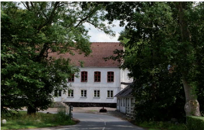
Hovedbygningen ved Høm Mølle er opført i 1856.