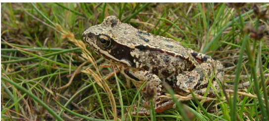
Der seltene Moorfrosch laicht im Ryde Forst

In den Tümpel sind Stockente und Teichhuhn zu sehen. Ansonsten wird der Forst von den charakteristischen Waldvögeln dominiert. Unter den Standvögeln finden Sie die Tannenmeise, die Sumpfmeise und den kleinsten Vogel Dänemarks, das Goldhähnchen. Im Frühjahr, wenn die Zugvögel kommen, gibt es gute Möglichkeiten, die Heckenbraunelle, die Mönchsgasmücke und die Singdrossel anzutreffen. Die Singdrossel ist erkennbar an dem hohen, klaren und melodischen Sang mit Themen, die sich 2- bis 4-mal wiederholen.