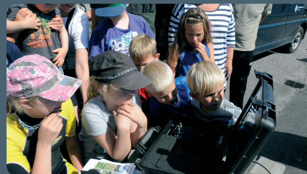
Livet i Hou Havn følges intenst via undervandskamera ved et offentligt arrangement i sommeren 2012