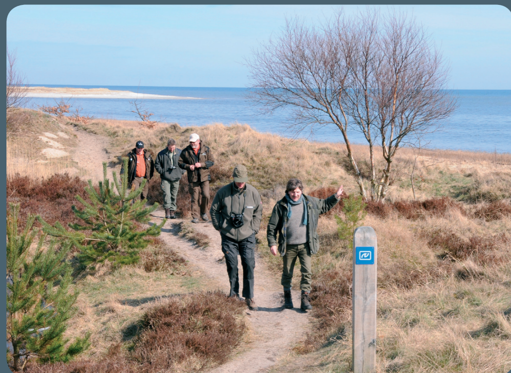
Vandretur langs Nordsøstien mellem Hou og Hals

Infocenter Hals står parat til at servicere dig med masser af turistinformation og kort om ruterne og Østkysten generelt.