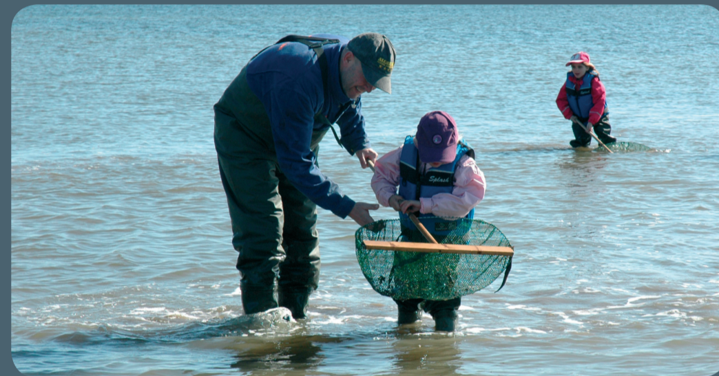
Jagten på rejer og krabber i Limfjorden er gået ind

Kyststrækningen her ved Skiveren er en af Aalborg Kommunes frie fiskepladser. Den er særdeles velegnet for børnefamilier på grund af det lave vand, hvor det er muligt at fange rejer, krabber og småfisk med rejestrygenet. Længere ude i fjorden kan du vade fiske efter havørred og hornfisk.