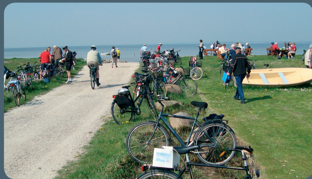
Kommunens naturvejledere benytter ofte Limfjordsruten i forbindelse med deres arrangementer. Her en seniorcykeltur til Klitgårds Fiskerleje ved Nibe

Regional cykelrute 23 er en ca. 180 km lang rundstrækning omkring Limfjorden mellem Aggersund i vest og Hals/Egense i øst.