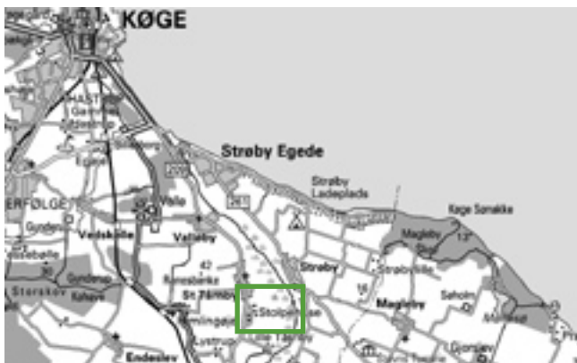
© Kort & Matrikelsyrelsen (G. 21-01)

Ærter Ærteplanten med sine slyngtråde kendes fra køkkenhaven, hvor bælgen, der er ærtens frugt, kan nydes frisk om sommeren. Ligesom kløver, er den i stand til at fiksere kvælstof fra luften. Ærterne dyrkes både til konserver og til foder.