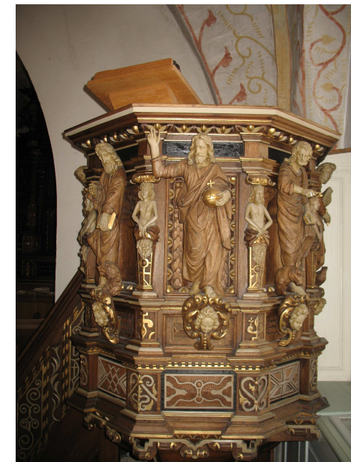
Prædikestol med Abel Schrøder figurer

Efter reformationen var prædikestolen, Alteret og døbefonten den treklæng der bar gudstjenesten, gennem Ordet på prædikestolen, og de to sakramenter som den lutherske evangeliske kirke holdt fast i da det var indstiftet af Jesus selv; Nadveren og Dåben.