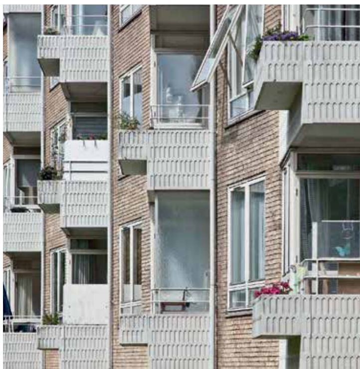
Bredalsparken 2650 Hvidovre

Bredalsparken inkluderede således et butikstov, der var tænkt som et naturligt samlende punkt i bebyggelsen. Idéen var, at det daglige indkøbsbehov skulle kunne dækkes lokalt, da kun ca. 7% af beboerne havde bil. Det var samtidigt også et tegn på, at de danske familiemønstre havde ændret sig, og at kvinden nu også arbejdede ude og derfor havde brug for at kunne handle ind tæt på hjemmet.