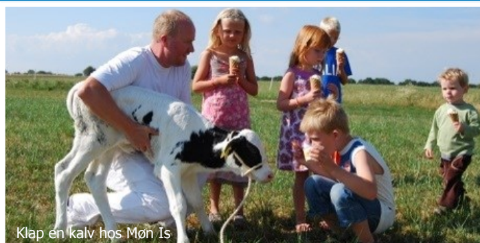
Klap en kalv hos Møn Is

Fra Ulvshalevej er der udsigt til Dronning Alexandrines Bro, øerne Lindholm og Nyord og Ulvshale skov. Turen slutter midt i den smukke middelalderby Stege (12) med byport og voldanlæg, museum og det levende handelsstrøg Storegade med restauranter og caféer.