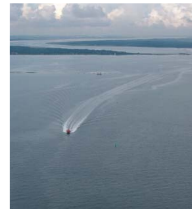
Limfjordens snævre forløb set fra Kattegat ind mod Hals

Den østlige Limfjord - fra Hals til Aggersund - er i dag et snævert farvand, hvor sejlrunden på begge sider er omgivet af meget lavvandede områder og strandenge. Mange steder rejser det faste morænelandskab sig langt fra den nuværende kyst. Ved Nibe- og Gjølv Bredning vider fjorden sig ud. Store inddæmninger har dog ændret det nordlige kystforløb radikalt.