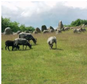
Græssende får på Lindholm Høje

I den tidlige jernalder får vi kendskab til små landsbyer med 6-8 gårde. For ca. 1800 år siden blev de mange små gårde lagt sammen til færre, men større. De store landsbyer placeres på toppen af de høje morænebakker, og her bliver de liggende til omkring år 1100 e.Kr. En typisk landsby med velbevaret gravplads kan ses på Lindholm Høje i Nørresundby. Den var beboet fra ca. år 400 til tidlig middelalder. Ved Sejflod er der omkring Toftshøj udgraven en landsby, der lå på stedet fra tidlig jernalder til vikingetidens slutning. På det tidspunkt blev bebyggelsen flyttet ned til den nuværende landsby med den romanske stenkirke. Samme mønster kan ses ved mange andre landsbyer med romanske kirker omkring fjorden.