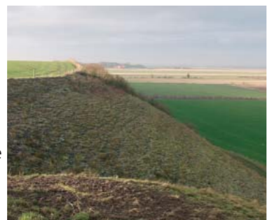
Stenalderkystskrænten ved Nørholm.

Meget store områder blev påny overskyttet og området igen omdannet til et ørige med utallige vige og smalle fjorde. Kystlinien lå nu 6-8 meter højere end i dag. Stenalderhavets kyst skrænter ses tydeligt mange steder i terrænet, bl.a. ved Nibe, hvor cykelruten følger foden af skrænten over lange stræk.