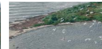
Troldholme i Limfjorden