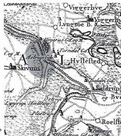
I 1791 var området præget af store, spredt bevoksede hedestrækninger. Videnskabernes Selskabs kort 1791.

De nye tider med udskiftning og skovindfredning omkring år 1800 bevirkede, at hede- og overdrevsarealerne langsomt skiftede karakter og efter fællesskabets ophør blev lagt til de enkelte gårde. Afgræsningen mindskedes, men ophørte ikke, træerne fik fred og kunne vokse op. Og da egen tåler kreaturers stadige nedbidning,