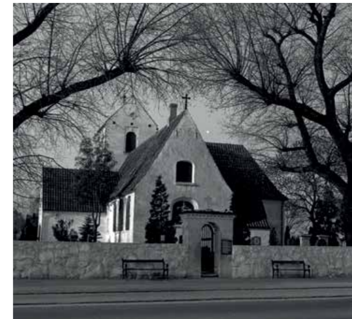
Den østlige indgang til Hvidovre Kirkegård, ca. 1960.

Hvidovre Kirkegårds ældste del er omgærdet af en mur fra 1787 bestående af kampesten og vingeteg. Muren erstattede et dige af løst opstabilede kampesten, som ofte skred ud. Kirkegårdens oprindelige hovedindgang var i østmuren, altså indgangen ved Hvidovrevej, mens den store port, ligporten mod syd, blev brugt til at bringe de døde ind på kirkegården. Der har sikkert også været indgange fra nord og vest, men på grund af udvidelser i flere omgange, senest i 1950'erne, er disse låger forsvundet.