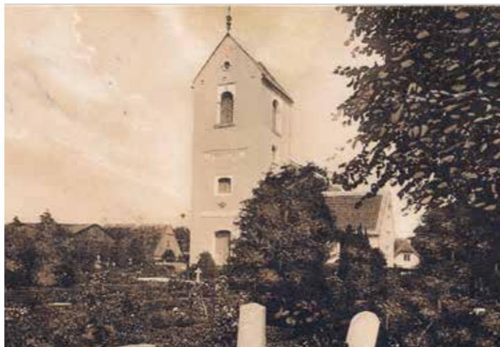
Hvidovre kirke, ca. 1925.

I centrum af den ældste del af Hvidovre Kirkegård ligger Hvidovre Kirke. Kirken blev bygget omkring år 1150, men har siden været igennem adskillige ombygninger og har sågar været delvis nedrevet under den svenske belejring i anden halvdel af 1600-tallet. Kirken har dog bevaret mange fine karakteristika fra den tidlige middelalders romanske periode, hvor den blev bygget.