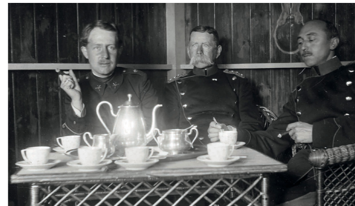
Eftermiddagskaffe i Officerspavillonen. 1890'erne.

Den over 100 år gamle Officerspavillon, som i dag atter står ved Forstadmuseet i Avedørelejren, har en særlig - og ikke helt upikant historie bag sig. Pavillonen blev sandsynligvis bygget i 1899. Den stammer fra den for længst nedlagte Paradislejr, som fungerede som militærlejr for kompagniet, der var stationeret ved Vestvolden. Paradislejren blev opført i 1896 på en mark ved Paradisgården, som lå der, hvor den vestlige del af Avedøre Stationsby ligger i dag. Anvendelsen af Paradislejren som egentlig militærlejr ophørte med opførelsen af den nuværende Avedørelejr i 1911-13. Paradislejren blev revet ned i 1960'erne i forbindelse med opførelsen af Avedøre Stationsby. Den eneste bevarede bygning var da Officerspavillonen, som stod forfalden og slidt i en tilgroet del af haven til den tidligere Paradisgård.