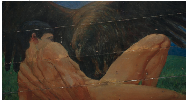
Prometheus angribes af ørnen.