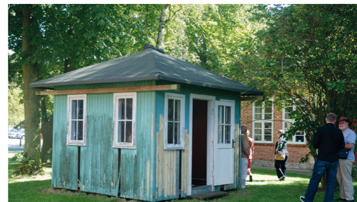
Officerspavillonen anno 2005.

I 1969 flyttedes pavillonen til Avedørelejren, hvor den placeredes i Officersmessens have. Her blev den sat i stand af lejrens tømrer. Pavillonen tilhørte på dette tidspunkt formelt Officersforeningen i Kongens Artilleriregiment og efter regimentets flytning til Sjælsmark Kaserne, anmodede officersforeningen om at få pavillonen overflyttet dertil i 1995. Her stod den så indtil 2005.