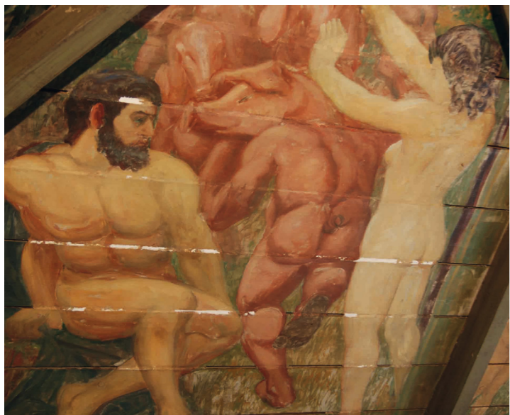
Odysseus' mænd, der forvandles til svin.