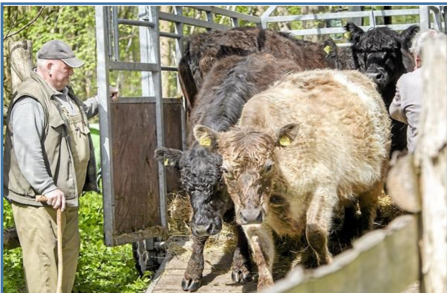
Foto: Køer med kalve lukkes ud på Flommen i maj måned.

Adgang ind til dyrene kan ske hvor der er opsat låger eller stenter. Der skal holdes respektfuld afstand